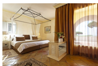
La suite du Parc.