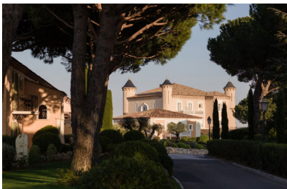
Le Château de La Messardière .

Du sommet de sa colline, ce château internationalement connu et reconnu – il a été distingué palace cette année – fait le bonheur de ses hôtes depuis vingt ans... Cette année encore, les chambres de sont parées des couleurs de la Provence. Visite guidée.