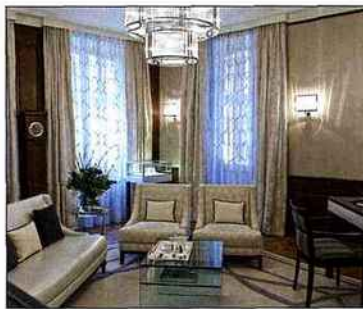
Le nouvel aménagement «comme à la maison» des boutiques Gübelin.