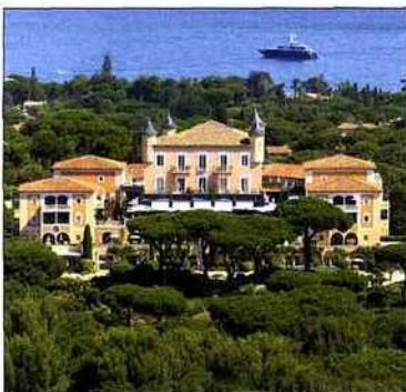
Le Château de la Messardière a accueilli un pop-up store Chopard.