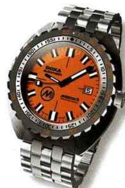
La DOXA Mission 31 SUB a accompagné les membres de la Mission 31 sous l'eau.

La DOXA Mission 31 SUB est devenue la montre de l'aventure par excellence lorsque Fabien Cousteau est sorti de l'eau, à la fin de la Mission 31, en la portant à son poignet. La montre avait été choisie comme chronomètre officiel des temps réalisés par les membres de l'équipe de Fabien Cousteau. La mission sous-marine de trente et un jours a établi un nouveau record d'immersion pour l'exploration océanique. DOXA a commémoré cette mission en réalisant une édition limitée de 331 pièces de sa montre légendaire à la face orange. Les 31 premiers exemplaires avaient été donnés aux membres de l'équipe Cousteau et ont passé trente et un jours sous l'eau avec eux.