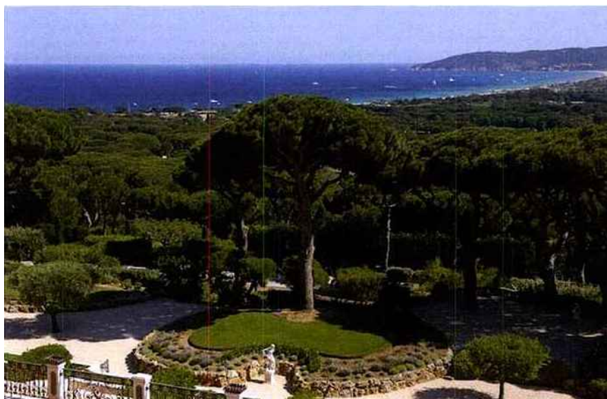
Bienvenue au Château de la Messardière

Qui dit nouvelle rentrée dit aussi nouvelle finale de la Messardière Golf Cup " Race to Saint-Tropez " et nouveau prix spécial décerné par Luxe-Magazine . Entre compétition de prestige et décors bucoliques, Luxe Magazine vous dit tout sur cette troisième édition riche en rebondissements.