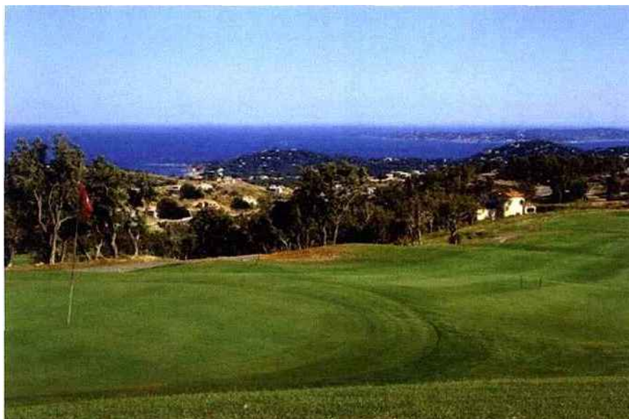
Golf de Sainte-Maxime

A la clé, 3 wilds cards offerts pour participer à un Play-Off inédit (17 septembre au Golf de Sainte-Maxime ) ainsi qu'un hébergement digne des plus grands palaces au désormais mythique Château de la Messardière (Hôtel & Spa 5*) Pour les plus cunieux d'entre vous, sachez que pour le moment, ce sont des joueurs bretons ( Goulven Glouzouic index 1,7) et varois ( Clément Dragon index 8,1) qui se partagent la tête du classement général