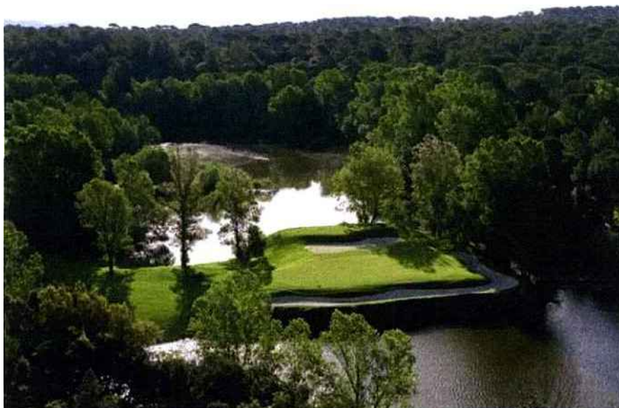
Le Golf de Saint-Enréol