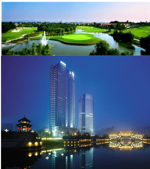
Venue : Shangri-La Hôtel...