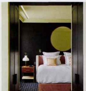
FRANCE / PARIS

Place de l'Eglise, Val Thorens, France. Téléphone : 04 79 00 04 78. www.hotelfitzroy.com