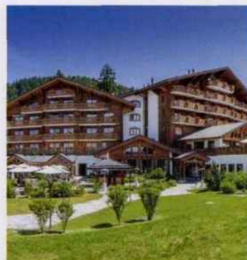
SUISSE / VILLARS-SUR-OLLON

28, rue Saint-Roch, Paris, France. Téléphone : 01 70 83 00 00. www.leroch-hotel.com