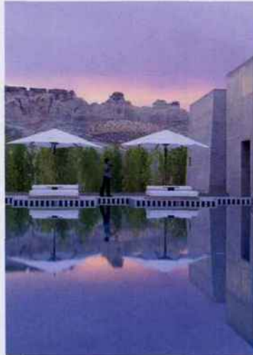
ETATS-UNIS / POINT UTAH

2165 Hazako Hamajima-cho, Shima, Japon. www.aman.com