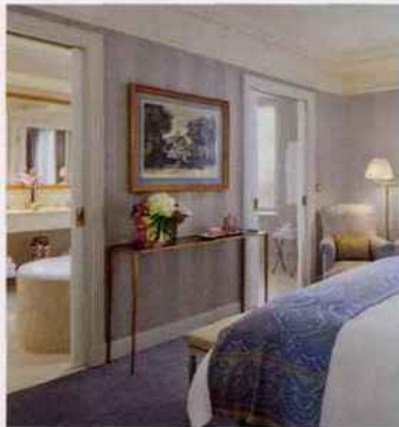
SUISSE / GENÈVE