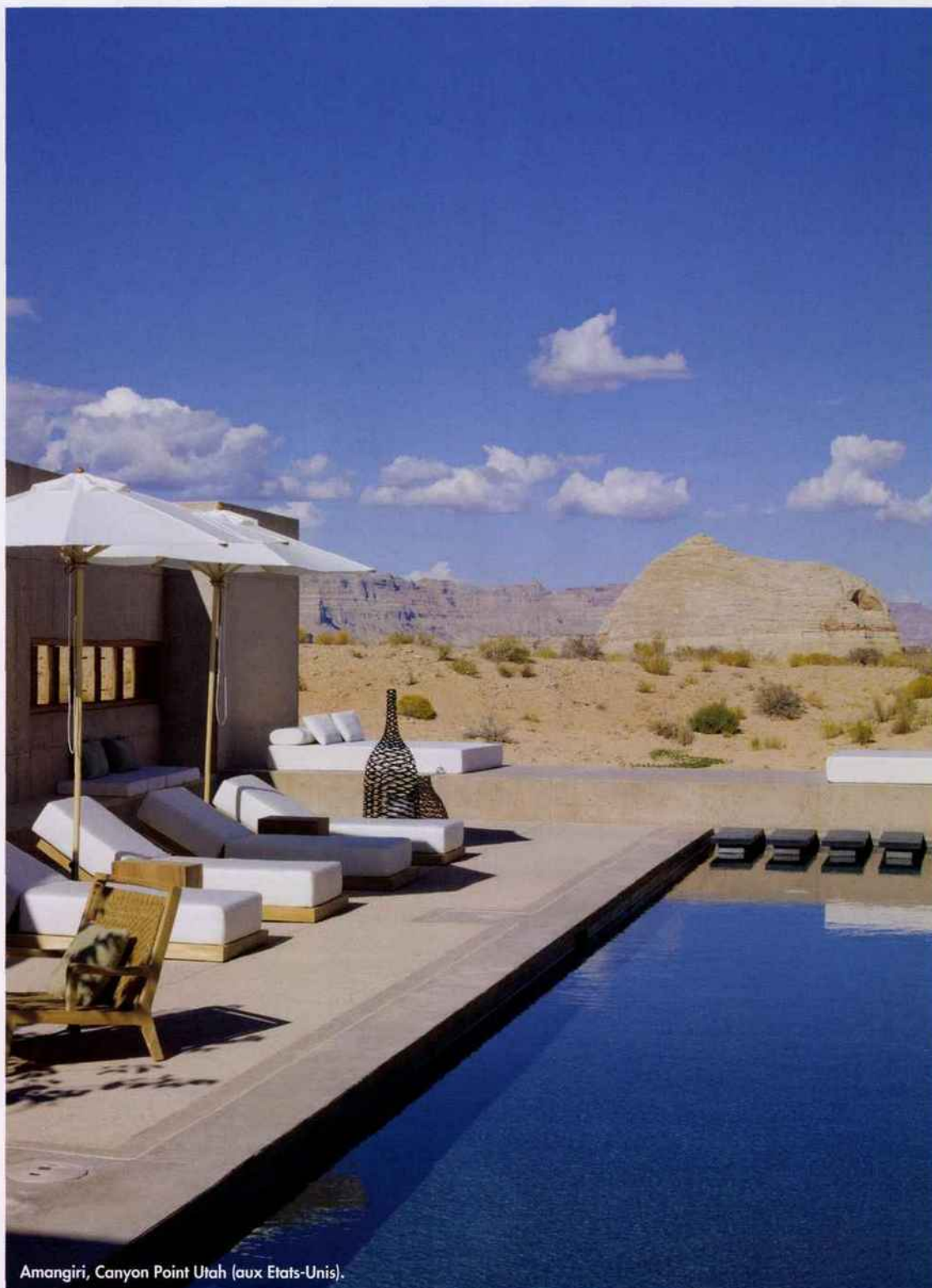
Amangiri, Canyon Point Utah (aux Etats-Unis).