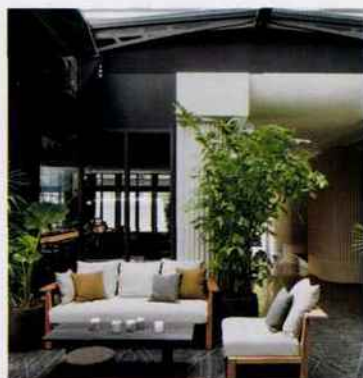
FRANCE / VAL THORENS