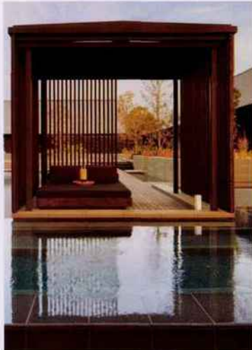
JAPON / SHIMA-SHI