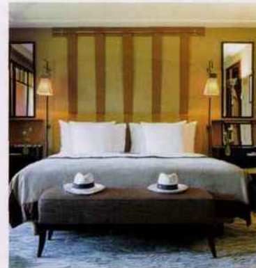
SUISSE / GENÈVE

Avenue Bab Jdid, Marrakech, Maroc. www.mamounia.com