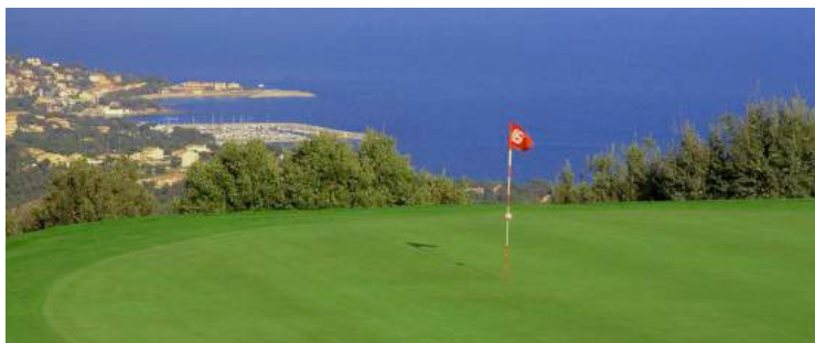
Официальная афиша Автор: Шарлотта Галлу / Charlotte Galloux

Messardiere Golf Cup 2016 Race to Saint-Tropez