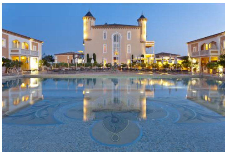
Château de la Messardière