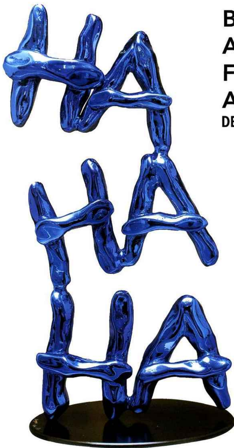
Philippe Bory, HA HA HA bronze et projection d'argent teinté édition originale 8 ex + 4 e.a. - 57x29x18 cm