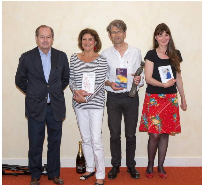
Les finalistes 2015 du Prix Messardière accompagnés de Jean-Marie Rouart, Président du Jury 2015