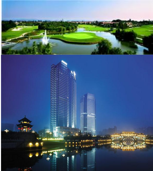
Veranstaltungsort: Shangri-La Hotel ...